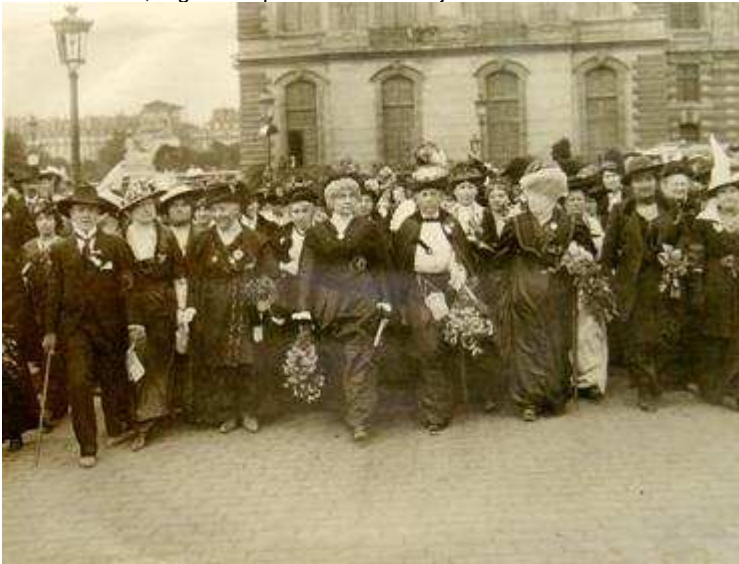
Manifestation Condorcet 1914