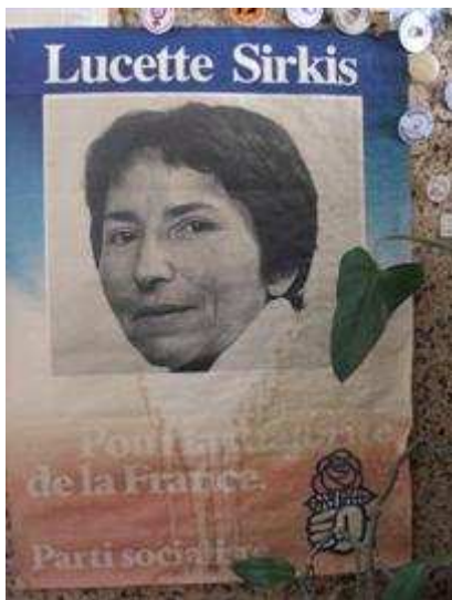
Affiche de candidature de Lucette Sirkis aux législatives (mars 1978)