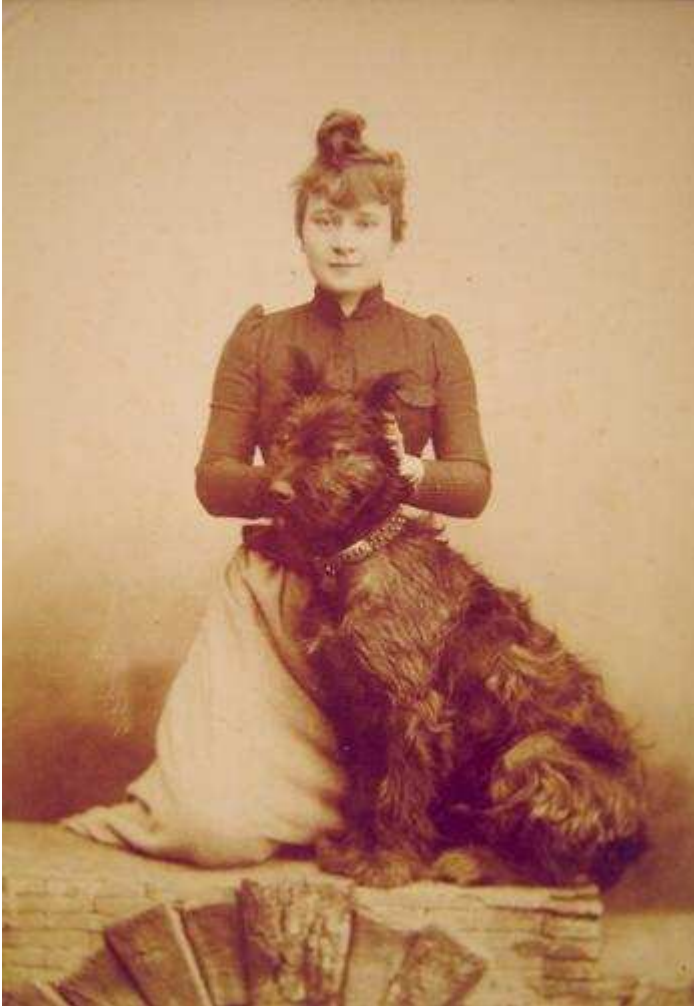
La Goulue et son chien