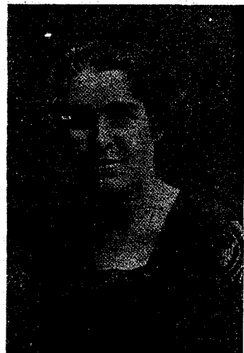
Mrs. MARGARET CORBETT-ASHBY Présidente de l'Alliance Internationale des Femmes.

Des applaudissements nourris accueillent la lecture de cette dépêche, puis Mme Corbett-Ashby, présidente de l'Alliance, prononce un long et beau discours dont nous reproduisons les passages essentiels :